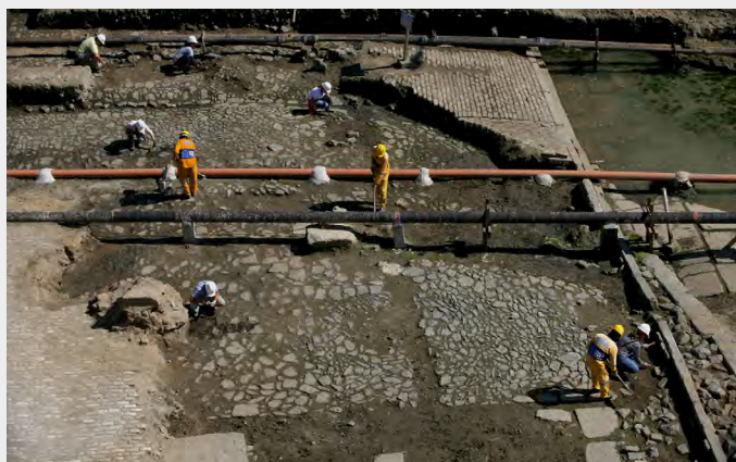
Fouille du quai de Valongo, réalisée à Rio de Janeiro au Brésil en 2011. On y reconnaît les deux strates de chaussée successives.

À l'occasion du réaménagement de la zone portuaire de Rio de Janeiro, avant les JO de 2016, une fouille a révélé au grand jour tout un pan du passé de la ville. Sous le bitume carioca, les archéologues ont dégagé les vestiges de deux quais superposés. Construit en 1811, le plus ancien et le plus vaste, appelé quai de Valongo, était destiné aux bateaux négriers. Pendant trois décennies, quelque 900 000 Africains y ont transité contre leur gré. Puis, en 1843, le débarcadère aux esclaves a été remblayé et recouvert d'un quai flambant neuf, digne de recevoir l'impératrice Thérèse-Christine de Bourbon-Siciles, venue épouser l'empereur Pierre II.