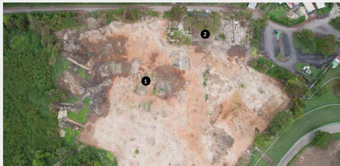
Vue zénithale du site de fouille, en bordure de l'hippodrome, en Guadeloupe. On distingue ❶ les bâtiments industriels et ❷ le quartier d'esclaves.

Sur ces terres, l'hippodrome de Guadeloupe dessine une grande forme oblongue, mais il n'en a pas toujours été ainsi. En fouillant les abords de la piste, les archéologues ont retrouvé les traces d'une purgerie, d'une sucrerie et de multiples rangées de cases rectangulaires formant un quartier d'esclaves. Une habitation-sucrerie se trouvait donc ici. Ce genre de domaine comprenait plantations, ateliers de transformation, rues « cases-nègres » et maison du maître. Il permettait au colon d'exercer un contrôle permanent sur ses esclaves. Produit ainsi à moindre coût, le sucre était vendu fort cher en métropole. En 1830, à l'apogée du système des habitations-sucreries, la Guadeloupe en comptait plus de 600, qui employaient près de 90 000 esclaves.