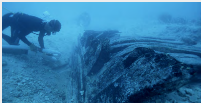
Fouille sous-marine autour de l'épave de l' Henrietta Marie , naufragée en 1700 au large de la Floride.

C'était un navire négrier ordinaire. Chargé de vaisselle en étain et de perles de verre, l' Henrietta Marie quitte Londres en septembre 1699. Sur les côtes d'Afrique occidentale, l'équipage troque sa cargaison contre de l'ivoire et plus de deux cents captifs – hommes, femmes et enfants. Puis le bateau reprend le large, direction la Jamaïque. C'est là, après deux mois de traversée enchaînés dans les cales, que les esclaves sont vendus. On charge alors du sucre, du coton, de l'indigo et du bois à revendre en Europe. Mais le navire sombre sur le chemin du retour, en mai 1700, emportant les espoirs de fortune de ses armateurs. Les vestiges archéologiques de cette folie commerciale ont été découverts sous les flots, au large de la Floride.