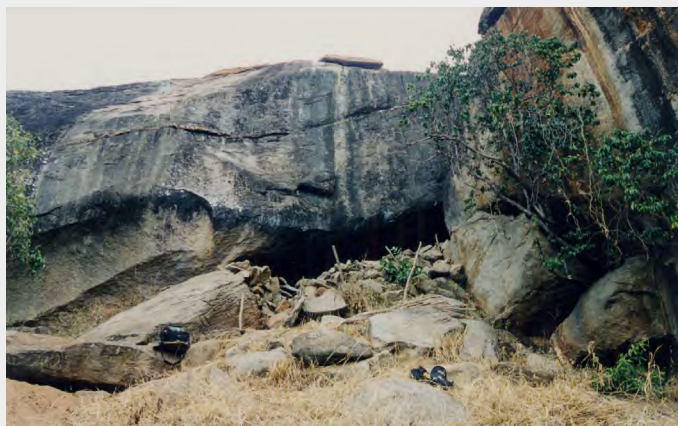
L'un des abris-sous-roche fortifiés utilisés pour échapper à la traite et aux violences, découvert sur le mont Kasigau au Kenya.

Il en a fallu des efforts, pour monter pierre à pierre des murets aussi épais, dans des endroits aussi inaccessibles. Sur le mont Kasigau, au sud du Kenya, ont été découverts les vestiges d'une trentaine d'abris naturels fortifiés. Ils servaient de refuges temporaires, où l'on se repliait en cas d'alerte. Nichés en pied de falaises, ils se fondaient dans le paysage, permettant d'observer discrètement les alentours à des kilomètres à la ronde. De quelle terrible menace fallait-il ainsi se protéger? Au moment de l'utilisation de ces abris de montagne, entre le XVIII e et le XIX e siècle, les razzias d'hommes se multipliaient. Sur la côte, la traite négrière battait son plein.