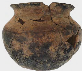
Marmite de tradition africaine en terre cuite, après recollage. Elle a été découverte lors de la fouille d'une habitation-sucrerie à Saint-Claude en Guadeloupe.

Elle a fini à la poubelle, cette marmite. Et c'est dans la fosse où on l'avait jetée, sur le site d'une ancienne habitation-sucrerie de Guadeloupe, qu'un archéologue l'a retrouvée. Pourquoi s'intéresser à cette modeste poterie? C'est qu'elle n'a rien d'européen ni d'amérindien, et qu'elle ressemble indéniablement par sa forme et son mode de fabrication aux poteries d'Afrique de l'Ouest. Rarement mentionné dans les archives, ce genre d'objet était certainement fabriqué par les esclaves pour eux-mêmes, selon des savoir-faire traditionnels. Une production discrète côtoyait donc la masse des céramiques que les esclaves fabriquaient utilisant des techniques européennes pour la production industrielle du sucre.