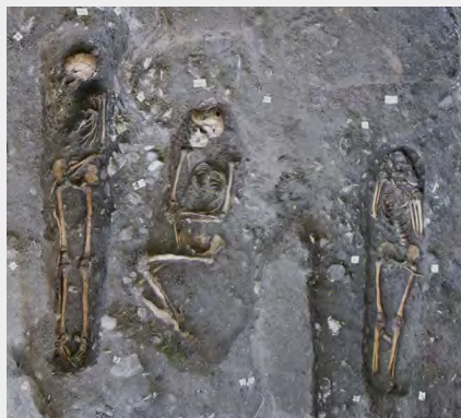
Les sépultures 53, 48 et 51 (de gauche à droite) découvertes à l'Anse Bellay. L'individu de la sépulture 51 présente des incisives supérieures taillées en pointe, pratique initiatique africaine.

Petite baie au sud-ouest de la Martinique, l'Anse Bellay n'est accessible que par la mer ou le sentier littoral. En ce lieu isolé, un crâne affleurant près du rivage a interpellé un randonneur. Appelés en urgence, les archéologues ont mis au jour les sépultures de 27 adultes, 2 adolescents, 13 enfants et 6 nouveau-nés. Ils avaient été enterrés en pleine terre, probablement nus dans un simple linceul, orientés est-ouest conformément aux pratiques catholiques. Certains avaient les incisives taillées selon des traditions africaines. Tout concourt donc à identifier le site comme un cimetière d'esclaves. Sur cette bande de terre littorale, des hommes et des femmes se sont emparés de la religion imposée par leurs maîtres pour offrir des funérailles à leurs proches.