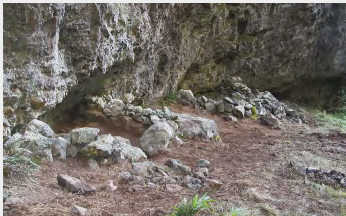
Structures en pierres sèches, vestiges de deux abris découverts dans une petite vallée du cirque de Cilaos à La Réunion ; le site a été fouillé en 2011 et en 2012.

Très montagneux, l'intérieur de l'île de La Réunion était un terrain propice pour les « marrons », ces esclaves qui refusaient de l'être et préféraient la fuite. En 1995, à 2 000 mètres, un guide de montagne a trouvé au fond d'une petite vallée encaissée les vestiges de deux abris. À une telle altitude, ce site accessible uniquement en rappel pouvait-il être lié au marronnage ? Une fouille archéologique l'a confirmé. Occupé au début du XIX e siècle, ce refuge secret servait aussi de halte de chasse : une parfaite connaissance de l'île permettait aux marrons d'échapper à la traque incessante des « chasseurs de nègres » en vivant de chasse et de cueillette.