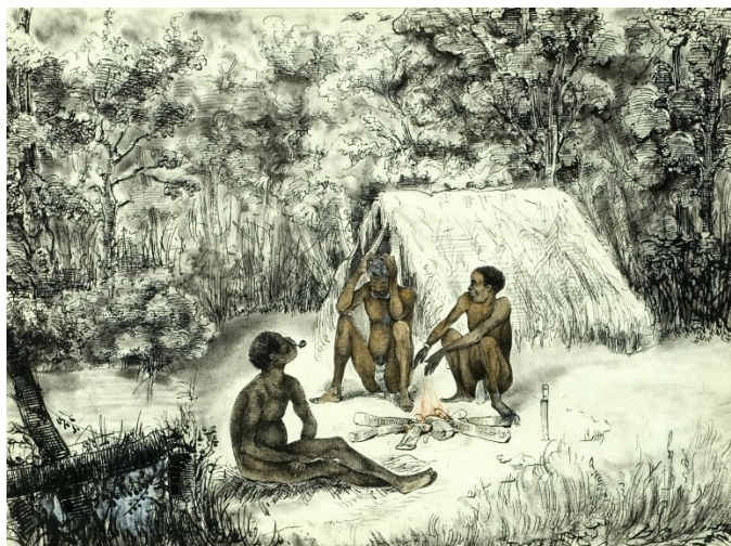
Figure 2 : Trois marrons à Surinam, Théodore Bray (1860)

Les résistances culturelles. Par exemple, préserver sa culture, ses pratiques, ses croyances et tout ce qui constitue son identité, protégeant ainsi son humanité. Un autre exemple peut être la mise en place d'une culture commune aux esclaves (langues, pratiques) permettant une communication et une solidarité.