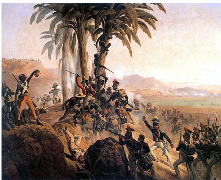
Figure 1 : La bataille de Saint-Domingue, January Suchodolski (1845)

Les révoltes et révolutions. Tous combats et batailles collectives contre les oppresseurs.